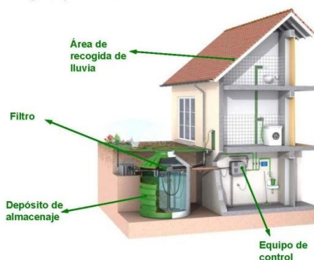
Componentes de un sistema de aprovechamiento de aguas pluviales